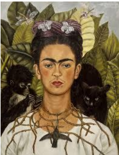
Autoportrait au singe, 1940